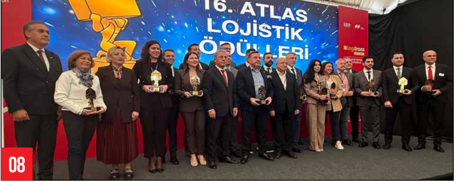
Lojistik Sektörünün En İyileri 16. Atlas Ödülleri'yle Taçlandı