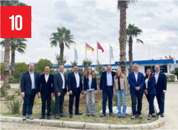
Bernard Krone'den KRONE Tire Fabrikası'na Ziyaret