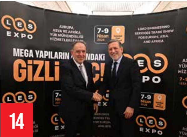
Yük Mühendisliği Hizmetleri 15 Milyar Dolarlık Büyüklüğe Ulaştı